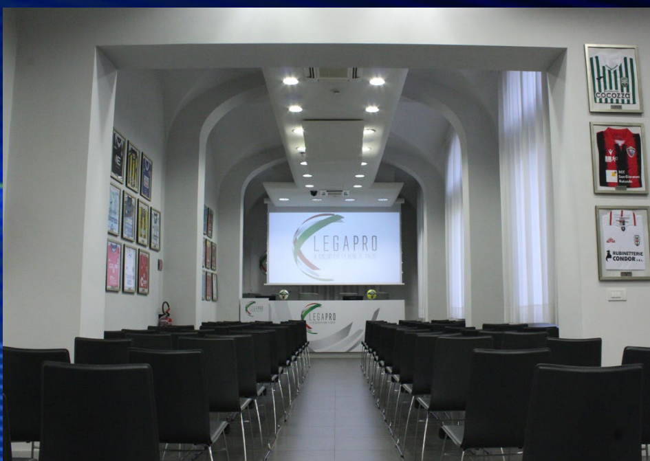
Foto della sala assembleare della Lega Pro presso la sede di Firenze

Verrà data informazione dell'accordo con un comunicato stampa concordato tra le parti.